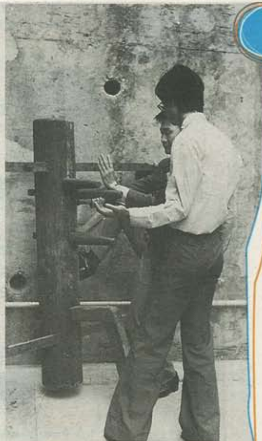
江Sir教書也會在學校與學生切磋，圖為他向學生示範如何利用木人樁練習。

江Sir曾於1989年出版書籍，將不同種類的作文錯處化作簡稱，如RPP等於Reported Speech、NTI等於Noun/Pronoun+to+Infinitive等，讓學生一目了然，改正之餘還要做練習，加深印象，更於1991年透過香港教育專業人員協會（教協）舉辦課程，講授遊戲教學和改文技巧。江Sir認為，教學離不開一個「樂」字，只有教得開心、學得開心，才有意義：「『樂』是學習的動機，如果有興趣，就自然會下苦功。」